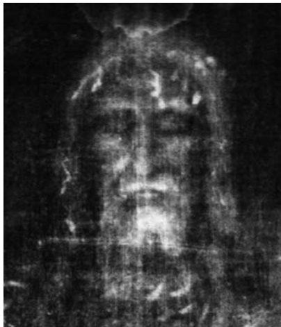
Turiner Grabtuch (Ausschnitt)

Katholische Pfarrgemeinde St. Laurentius in Berlin-Mitte